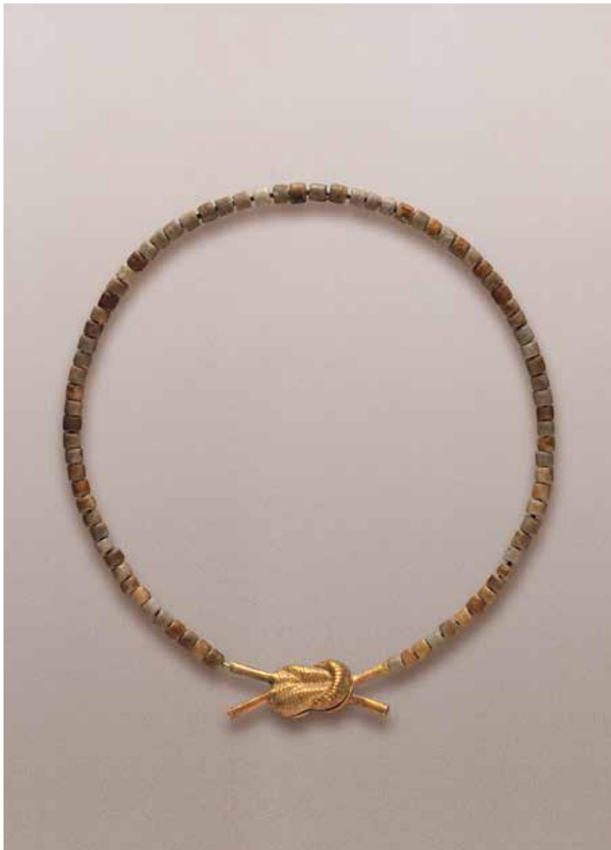
À esquerda: colar com nó de Hércules de ouro, que também pertenceu a Senebtisi