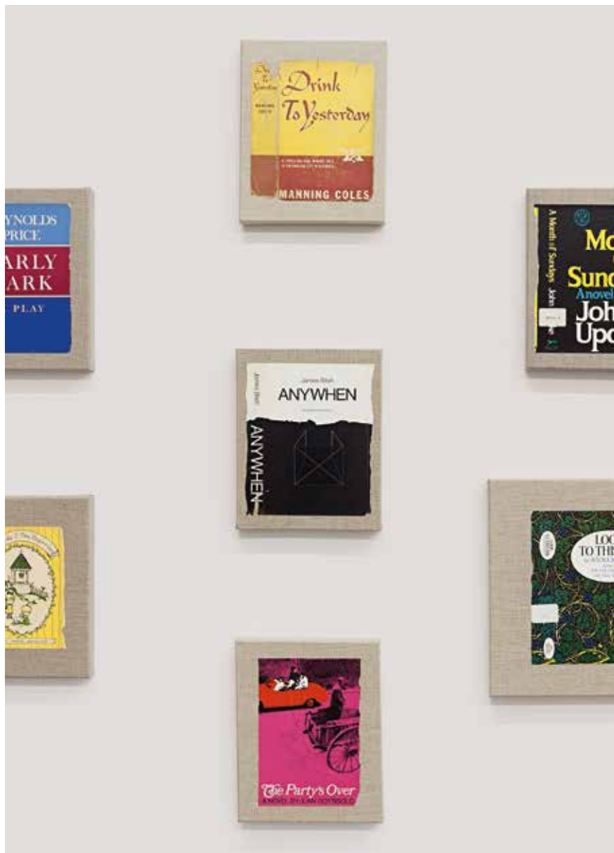
À esquerda: detalhe de Any Moment Now... (Fall) , obra montada com capas de livros sobre linho

que quiser, ou atuasse como os personagens de João e Maria, deixando pedacinhos de mão pelo caminho, puzzles. Parte de um encontro entre o público e o privado, o universal e o individual, que despertam insights, inquietações, posicionamentos perante o outro e perante si mesmo, como se nos olhássemos no espelho, material que também é bastante utilizado por ela. “Tem muitas questões filosóficas no meu trabalho. E tem também um exercício de resistência ao próprio trabalho, que é minha vida, meu dia inteiro. Não sento na cadeira, pego um papelzinho e começo a desenhar. É um processo de pensamento que não tem hora para acabar ou começar. São milhões de linhas narrativas sem post-it, sem story board. Penso em 50 coisas ao mesmo tempo, como se tivesse vários canais ligados.”